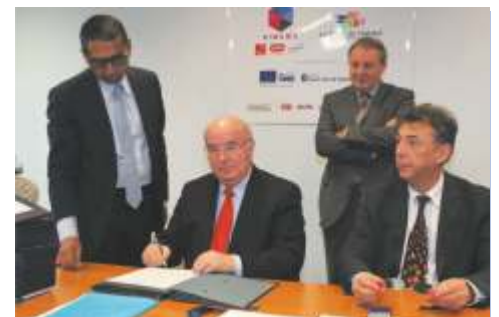
Tous les partenaires étaient présents le 12 novembre dernier pour la signature du contrat de partenariat.

deux évoquaient déjà un projet cinématographique mais ce n'est qu'en 2006, suite à une rencontre avec des dirigeants de l'Université de Valenciennes et du Hainaut-Cambrasis (UVHC) que les choses ont pris forme. » Car depuis 1977, l'Université forme une grande partie des personnels techniques de l'audiovisuel. « D'ailleurs aujourd'hui dans les grands groupes, il n'est pas rare de tomber sur des responsables qui ont suivi cette formation ! »