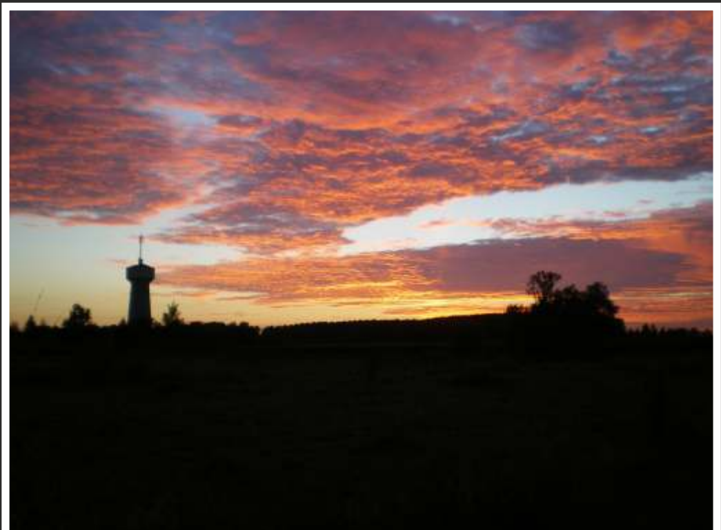
"Coucher de soleil sur le château d'eau" par Léone WILLAI d' Hasnon