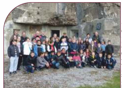
Collégiens de Denain au Fort de la Salmagne (Sambre)