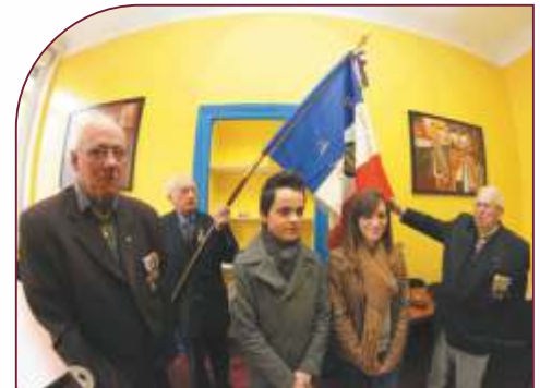
Collégiens de Saint-Amand avec des membres de la Fédération Nationale André Maginot

*Fille d'immigrés polonais, elle a été arrêtée dans la nuit du 30 au 31 janvier 1944 puis déportée.