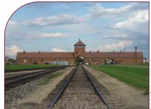
Entrée du camp de concentration d'Auschwitz