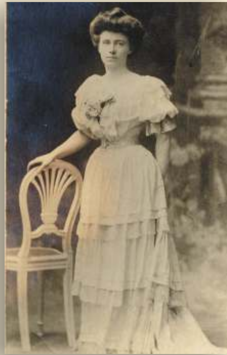
Louise DE BETTIGNIES, vers 1905 Collection particulière