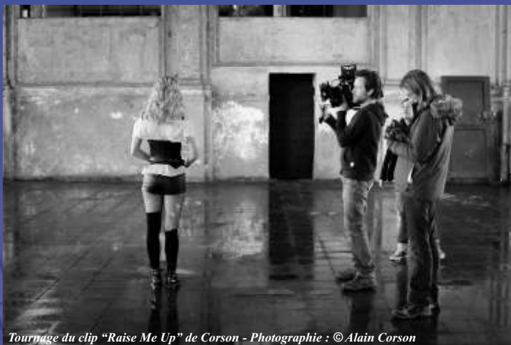
Tournage du clip "Raise Me Up" de Corson - Photographie : © Alain Corson

Un site également choisi par les professionnels du cinéma pour son potentiel visuel. D'ailleurs, à terme, l'offre actuelle devrait être complétée par l'aménagement d'un plateau de 1 000 m 2 , sous réserve bien sûr d'acquisition des financements partenariaux nécessaires. ■