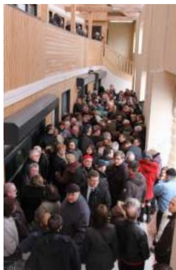
Le centre commercial d’Avesnes-le-Sec le jour de son inauguration

tout de suite été séduite. » Prise de contact avec la mairie, rencontre du représentant de la chaîne de distribution, « tout s’est enchaîné assez rapidement. »