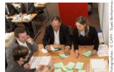
Composition du Conseil communautaire au verso.

question s'y trouve posée : celle de la géographie communautaire à venir ; celle de la pérennité de notre Établissement Public de Coopération Intercommunale et celle de la durée et des conditions de notre mandat. » Dans son intervention, le président de la Communauté d'Agglomération de La Porte du Hainaut a mis l'accent sur l'ensemble des politiques que l'Assemblée communautaire va mettre en œuvre (cf p.4) et poursuivre dans le prolongement du mandat qui vient de s'achever, au bénéfice des 46 communes et des 159 000 habitants de notre territoire. ■