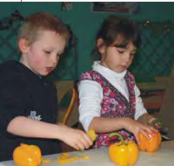
Atelier cuisine - École Bracke Desrousseaux