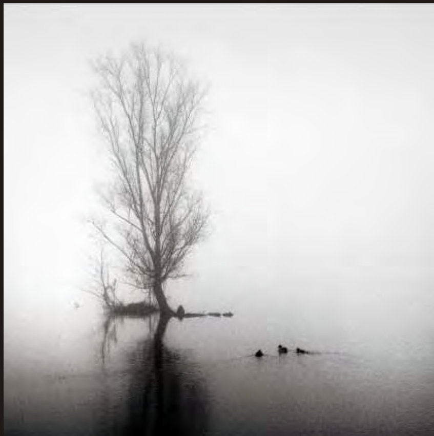
" Brouillard " Didier Platel de Bruille Saint-Amand

Grand marcheur notre infatigable septuagénaire a su réaliser ce magnifique paysage, lors d'une promenade cet hiver à la base de loisirs de Chabaud-Latour à Condé. " Nos plans d'eau, notre brouillard et nos lumières douces sont aussi source d'ambiance poétique " nous a-t-il confié.