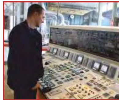
La nouvelle turbine - Photographie : GE ENERGY

mg/Nm 3 et le monoxyde de carbone de 300 à 30 mg/Nm 3 », toujours selon EDF. Le cycle combiné gaz sera composé d'une turbine à combustion et d'une turbine à vapeur qui seront chacune équipées d'un alternateur d'une capacité de 510 MW, ce qui devrait permettre d'alimenter en électricité l'équivalent de 600 000 foyers. ■