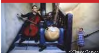
Ballaké Sissoko et Vincent Ségal

Programme complet disponible dans tous les lieux publics et sur www.agglo-porteduhainaut.fr . Possibilité de recevoir la brochure par mail, sur demande.