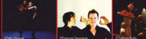
De gauche à droite : La Edad de Oro / Ma bande originale / D'une île à l'autre

synonyme de voyage avec trois artistes de renommée internationale : Israel Galván, Ballaké Sissoko et Vincent Ségal. Alors que le premier, Israel Galván, icône du flamenco contemporain, vous emmènera en un claquement de pieds viril d'Haulchin à son Espagne natale, le joueur de Kora (sorte de harpe-luth à 21 cordes d'origine mandingue) Ballaké Sissoko et le violoncelliste Vincent Ségal vous feront, eux, vibrer dans un lieu sacré : l'église de Château-l'Abbaye, tout juste rénovée. Enfin, autre rendez-vous à noter : le collectif G. Bistaki. Composé de cinq jongleurs et danseurs, alliant la danse, le cirque et le théâtre, il est réputé pour innover lors de chaque représentation en s'inspirant des lieux dans lesquels il se trouve. Un moment unique à ne manquer sous aucun prétexte ! Ces "hommes-tuiles" seront à Avesnes-le-Sec le 15 mai prochain. ■