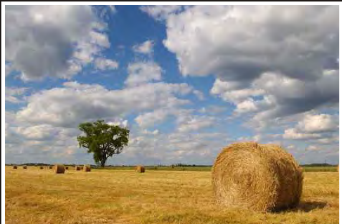
"Fenaison" de Fabien LEMORT Hélesmes