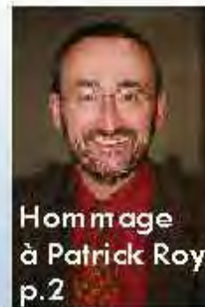
Hommage à Patrick Roy p.2

L'intercommunalité au coeur des débats p.3