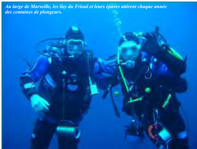
Au large de Marseille, les îles du Frioul et leurs épaves attirent chaque année des centaines de plongeurs.

donneraient presque aux plus angoissés d'entre nous, l'envie de chausser les palmes !