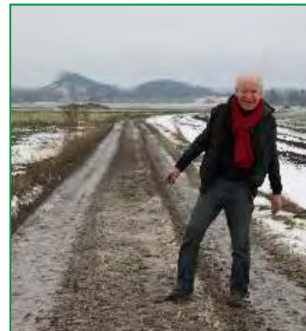
Le secteur pavé d'Haveluy.