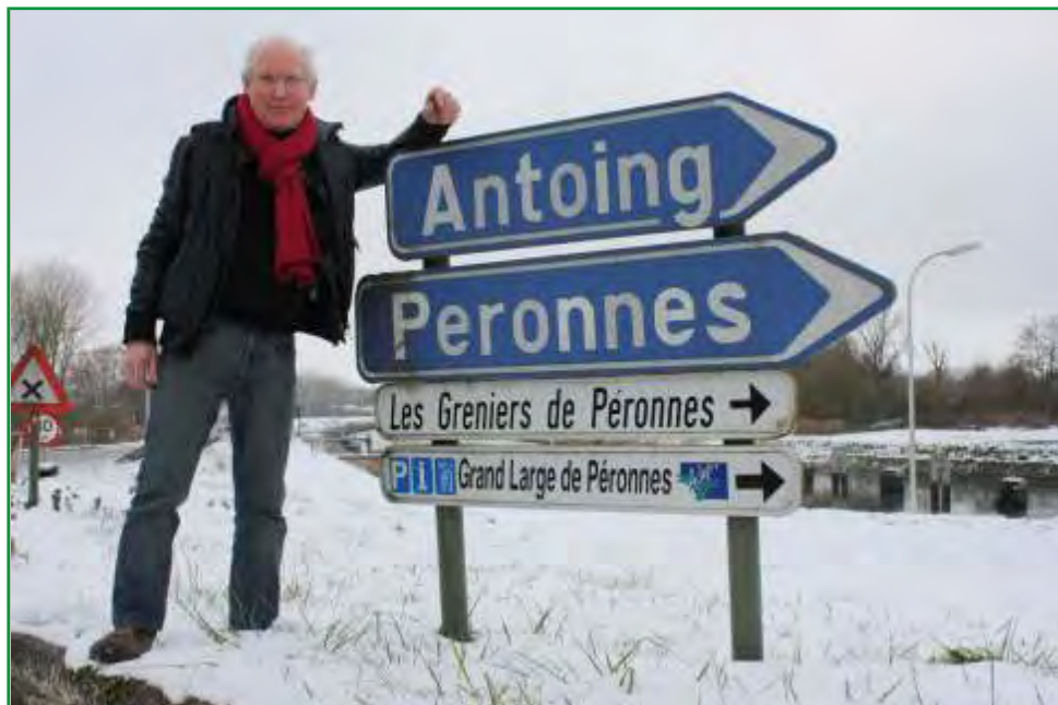
Top départ à Péronnes (Belgique).