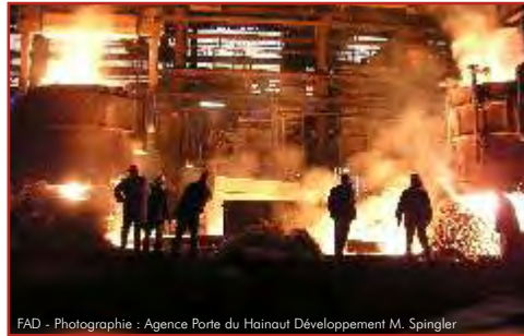
FAD - Photographie : Agence Porte du Hainaut Développement M. Spingler

représentants communautaires de s'investir encore et de développer des projets d'envergure. Petit tour d'horizons des faits majeurs de la soirée.