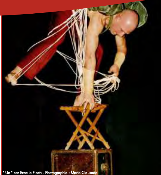
* Un * par Ezac le Floch