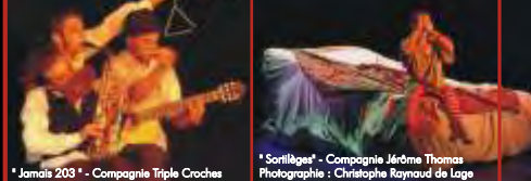
* Jamais 203 * - Compagnie Triple Croches