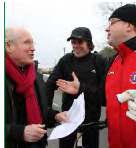
Sur le secteur pavé de Tilloy-lez-Marchiennes, rencontre avec des VTTistes.

Dans notre voiture, l'excitation monte d'un cran quand apparaît le secteur pavé de Wandignies-Hamage. « Le secteur le plus long : 3,8 km ! », s'exclame-t-il. Réponse fautive : "seulement" 2,7 km. « C'est parce que la route est rectiligne, difficile... Sur un vélo, cela semble plus long ! » Et pour finir d'exténuier les coureurs, à 10 km de l'arrivée, le secteur Bernard Hinault à Haveluy (2,3 km). « Si proche du but, il peut faire une petite différence. Et puis, c'est un costaud ! Non pas qu'il y ait un secteur plus compliqué qu'un autre, c'est plutôt la répétition qui fait mal. C'est près de 10 km de pavés coup sur coup ! De toute façon, il y aura deux courses ce jour-là : une pour ceux qui veulent gagner une étape, l'autre pour ceux qui veulent simplement rester en contact. » Parole de pro. ■