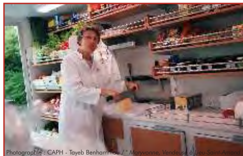
Photographie : CAPH - Tayeb Benhamou / L'Espresso, Vendredi 10 Janvier 2010

La CAPH est au côté des entreprises de son territoire auxquelles elle peut apporter soutien financier ou logistique pour s'implanter ou se développer. En contrepartie, ces entreprises aidées doivent assurer le recrutement de salariés dans les trois années qui suivent. Grâce à ce dispositif, déjà 90 emplois en CDI équivalent temps plein ont été créés sur le territoire. C'est bien plus que l'objectif des 54, fixé par la CAPH. Aléas économiques ou administratifs ayant retardé certains projets, les élus ont consenti un délai supplémentaire pour permettre aux entreprises concernées de tenir l'objectif.