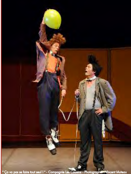
* Ça va pas se faire tout seul ! * - Compagnie Les Cousins