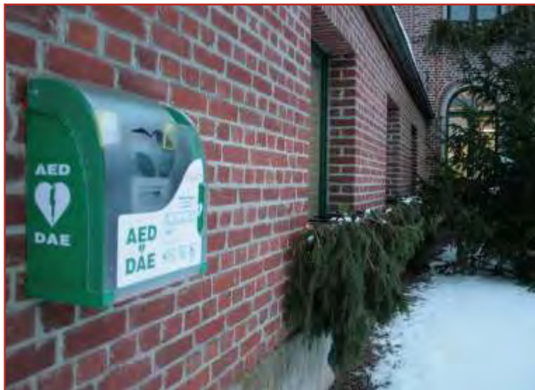
À la mairie de Millonfosse, un défibrillateur tout nouvellement installé.

E n août 2008, le malaise du footballeur valenciennois David Sommeil avait secoué les consciences. Les sportifs en plein effort sont particulièrement exposés au risque cardiaque. Cependant, 80% des morts subites dues à un problème cardiaque ont lieu à domicile. La première cause de décès en France ! Une "machine", appelée "défibrillateur", facile à utiliser, sans risque, peut vous sauver la vie, celle d'un voisin, d'un ami... Où se trouve le défibrillateur le plus proche de chez vous ? S'il vous plaît, trouvez le temps de vous informer. Si vous habitez le